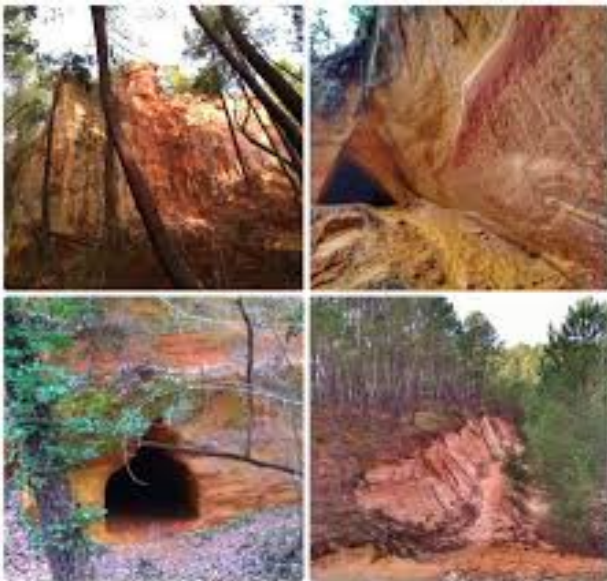
Les ocres de Mormoiron (Lac des Salettes)