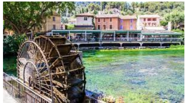
Fontaine du vaucluse